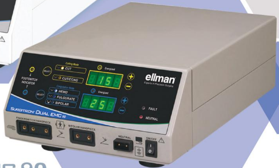
DUAL EMC 90