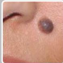
● ضایعات پوستی