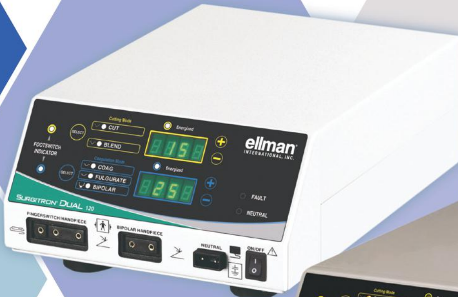
DUAL RF™ 120

The PRECISION you require with the VERSATILITY you need